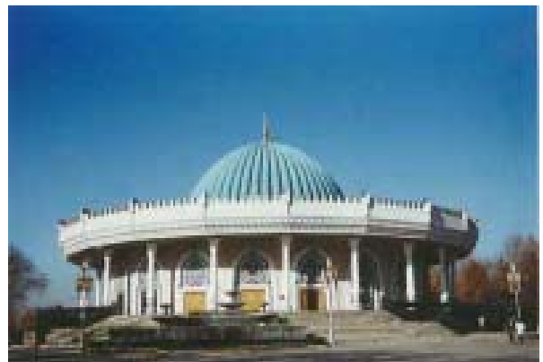
Музей Амира Тимура в Ташкенте.