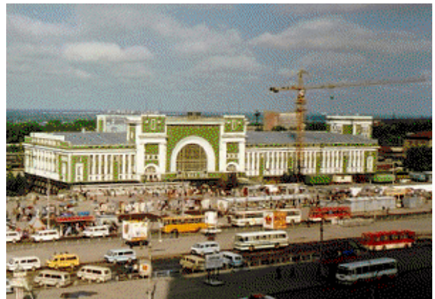
Новосиби́рск - железнодо́рожный вокза́л